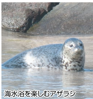
海水浴を楽しむアザラシ

七月八日の朝、戸田・御浜海水浴場にアザラシが現れました。この日は前日に行われた海開きを受け、海水浴場の遊具や港まつりの花火用の台船を準備する日となっていて、海岸では戸田観光協会や商工会青年部などが作業を行っていました。野生のアザラシということもあり、人間を警戒しながらも砂浜に上がったりにして、三時間ほど海水浴を楽しんでいました。