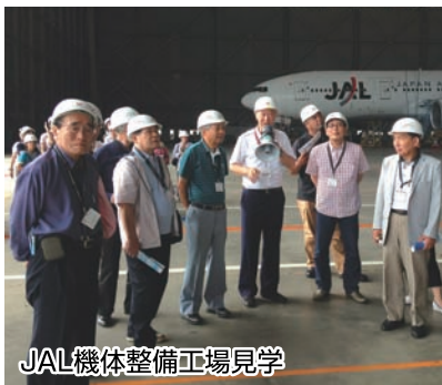
JAL機体整備工場見学

多くの整備士さんが機体に群がるように作業する様子はとても壮観で、この人たちのお蔭で安全が確保されているのだと、頭の下がる思いがしました。参加者のみなさまも自らが働く人たちなので、同じ思いで、自身の仕事に自信や誇り、明日への希望を再認識されたことと思います。