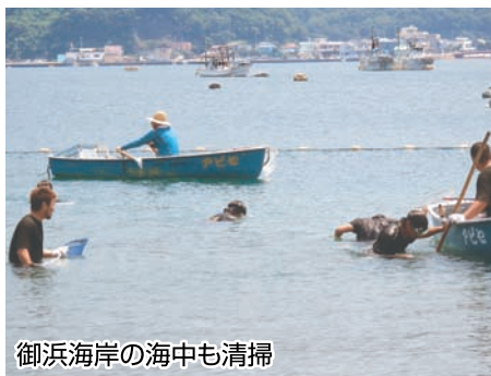
御浜海岸の海中も清掃

七月十日、毎年恒例となっている御浜海岸清掃が行われました。戸田観光協会を中心に、商工会青年部、法人会戸田支部、地元自治会の関係者、ボランティアの方々など参加人数は約一〇〇人となり、砂浜側と外海側に分かれて作業を行いました。一週間前の雨の影響もあり、外海側の岩場には多くのゴミがありました。皆様のご協力もあり、スムーズに清掃作業を行うことができました。海水浴場の水はとても澄んでいてきれいな状態で観光客の皆様をお迎えできるようになりました。